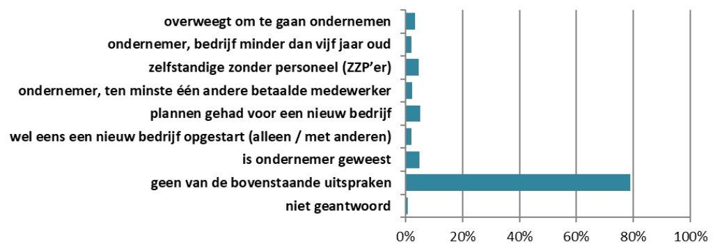
figuur 2-1 situaties die op de respondent van toepassing zijn (n = 886, meer antwoorden mogelijk)

De percentages wijken niet wezenlijk af van die uit 2017 en 2019, toen een vergelijkbare vraag werd gesteld.